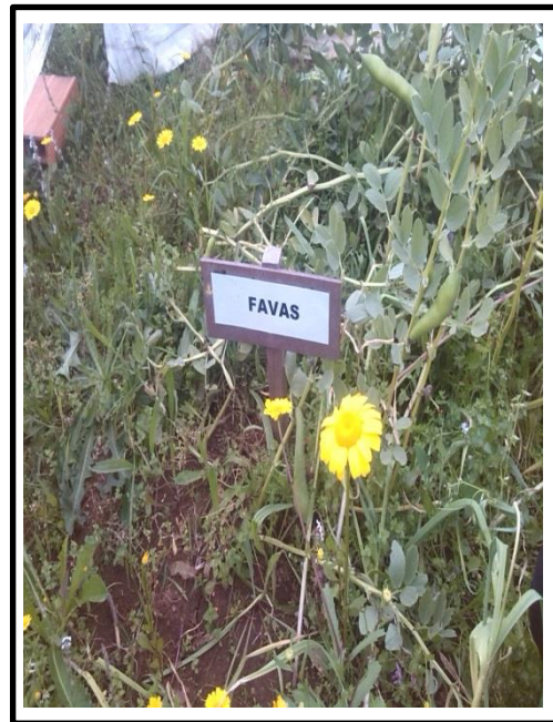
Desenvolvimento da planta